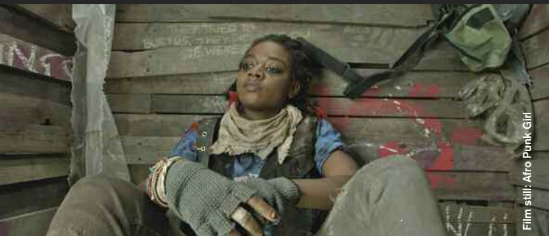
Film still: Afro Punk Girl

The Truants (Drama) D: Aaron Dunleavy, 13:00 Leo und Michael schwänzen die Schule und begeben sich auf ein gefährliches Abenteuer. Two teenage boys break free from school to embark on a dangerous adventure.