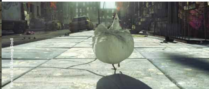
Film still: A Morning Stroll

A Morning Stroll (Animation) D: Grant Orchard, 7min, British Shorts Audience Award 2012 Ein New Yorker Huhn braucht seinen Morgenspaziergang. When a New Yorker walks past a chicken on his morning stroll, we are left to wonder which one is the real city slicker.