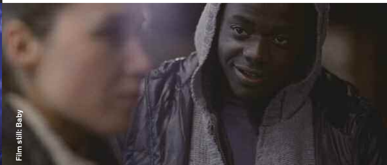
Film still: Baby

Baby (Drama) D: Daniel Mulloy, 25:00, British Shorts Jury Award 2012 Sara (Arta Dobroschi aus "Late Bloomers") wird auf dem Heimweg von einem Mann verfolgt. Zuhause angekommen drehen sich die Machtverhltnisse jedoch ... Sara (Arta Dobroschi from "Late Bloomers") is followed home by a young crook but things turn out unexpectedly.