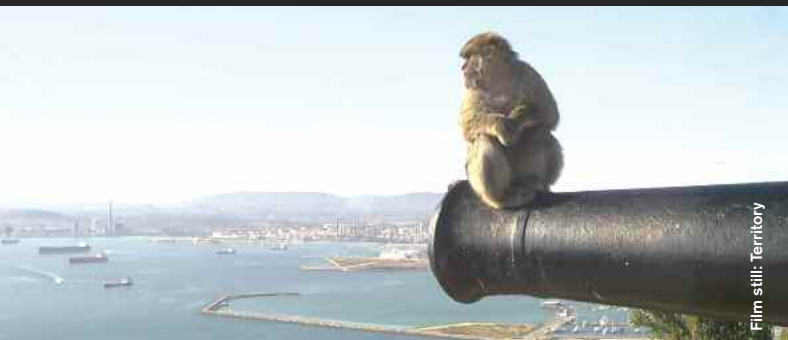
Film still: Territory

The Banana Republic (Documentary), D: Scott Calonico, 10:00 Der karge Edinburgher Wohnblock "Banana Flats" (Drehort für "Trainspotting") und seine Bewohner. The famous "Banana Flats" in Leith/Edinburgh and the people who live there.