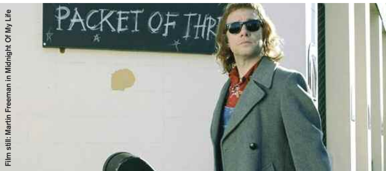
Film still: Martin Freeman in Midnight Of My Life

Midnight Of My Life (Drama) D: Phil Davis, 7:00 Martin Freeman ("Der Hobbit") als "Small Faces"-Sänger Steve Marriott in einem Film über Talent, Altern und Bedeutung von Erfolg. A poignant study of talent, aging and what success means, starring Martin Freeman as Small Faces lead singer Steve Marriott.