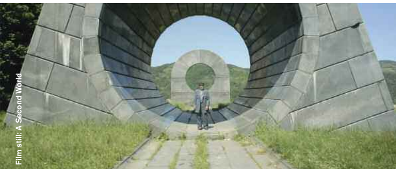
Film still: A Second World

Uprooted (Documentary) D: Ross Domoney, 26:00 Ein Wohnkomplex in Brixton fällt der Gentrifizierung zum Opfer und die Bewohner wehren sich. In the middle of a rapidly changing London, a housing crisis rips through the capital eating up communities and council estates along the way.