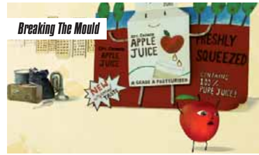
Breaking The Mould