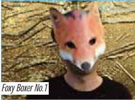
Foxy Boxer No.1

Eintritt: 3 Euro (Konzert & Party) Tickets: 030.6941147 oder www.sputnik-kino.com