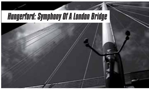
Hungerford: Symphony Of A London Bridge