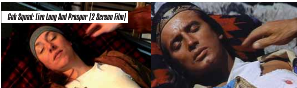
Gob Squad: Live Long And Prosper (2 Screen Film)

Who Cares (Comedy), R: Simon Bennett-Leyh, 11:00min