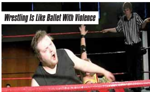
Wrestling Is Like Ballet With Violence