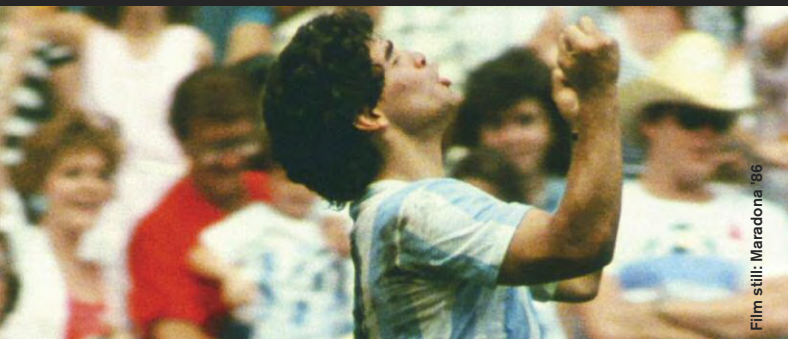
Film still: Maradona '86