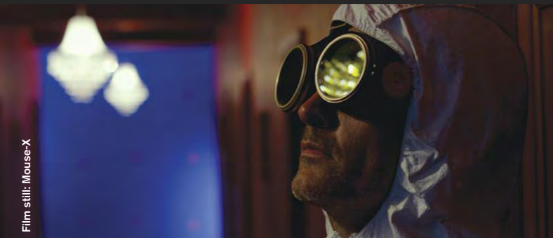
Film still: Mouse-X

Thriller / Drama / Animation / Comedy / Science Fiction