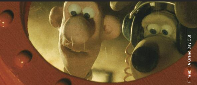
Film still: A Grand Day Out