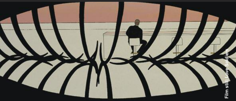
Film still | Love Soldiers

Animation / Afterwards: Screening Of This Year's Audience Award Winner Film!