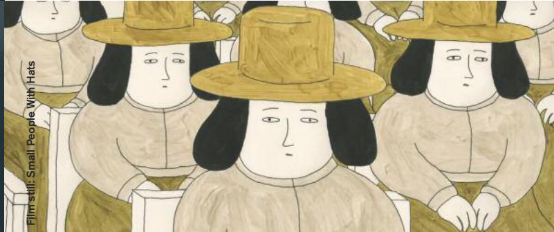
Film still: Small People With Hats

Drama / Animation / Comedy / Music Video / Mystery