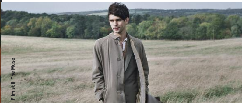
Film still: The Muse

Drama / Animation / Comedy / Experimental