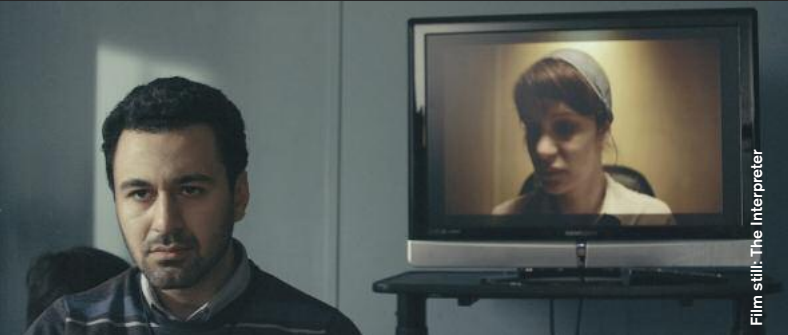
Film still: The Interpreter

The Interpreter (Drama), D: Kyla Simone Bruce, 20:00 Ramzi wird als Übersetzer bei einem Londoner Einwanderungsgericht vor ein moralisches Dilemma gestellt. An interpreter in a London immigration court unwittingly gets involved with a client.