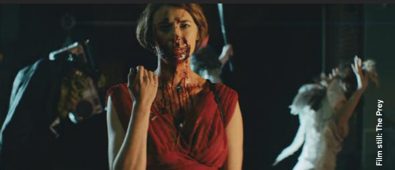
Film still: The Prey

Horror / Thriller / Black Comedy / Animation / Fantasy / Science Fiction