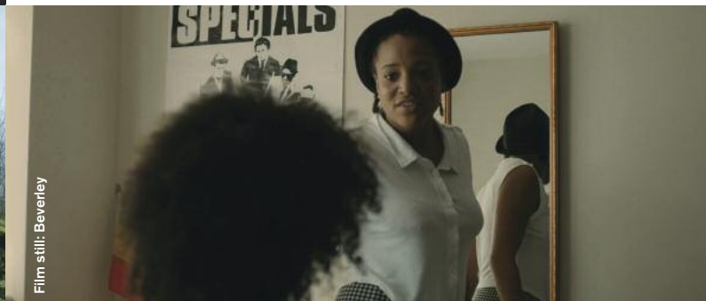
Film still: Beverley

Drama / Comedy / Animation / Experimental