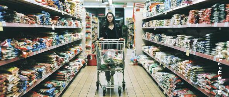
Film still: The Pig Child

Drama / Sci-Fi / Animation / Comedy / Thriller / Documentary