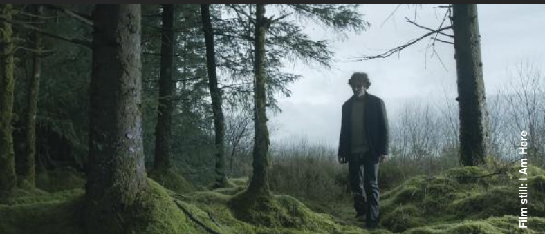
Film still: I Am Here

Drama / Animation / Experimental / Sci-Fi / Romance / Thriller / Comedy