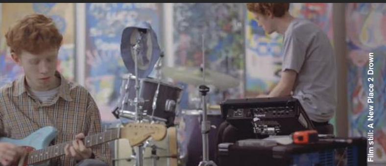
Film still: A New Place 2 Drown

The Reinvention Of Normal (Documentary/Animation), D: Liam Saint-Pierre, 7:45 Für Künstler, Erfinder und Designer Dominic Wilcox ist nichts unmöglich! Dominic Wilcox is an artist/inventor/designer who takes the normal and turns it into something unique.