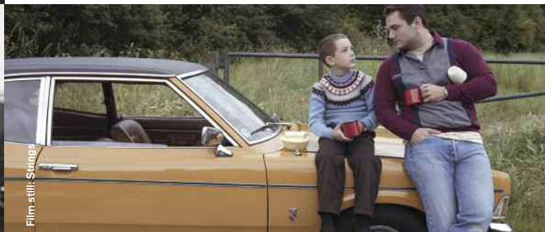
Film still: Strings

Drama / Comedy / Animation / Coming Of Age