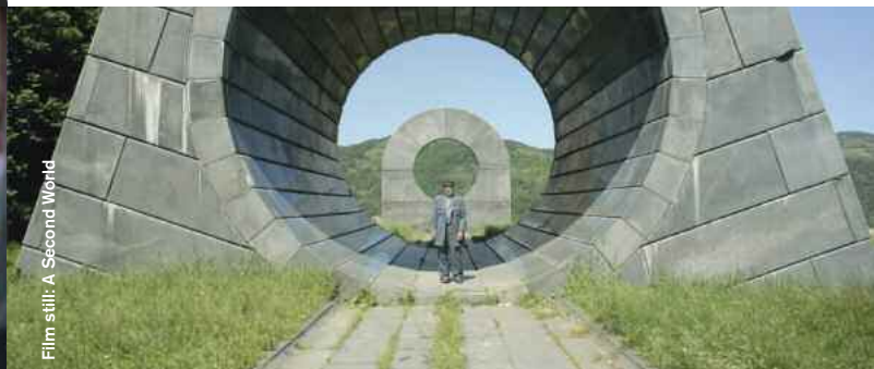
Film still: A Second World

Uprooted (Documentary) D: Ross Domoney, 26:00 Ein Wohnkomplex in Brixton fällt der Gentrifizierung zum Opfer und die Bewohner wehren sich. In the middle of a rapidly changing London, a housing crisis rips through the capital eating up communities and council estates along the way.