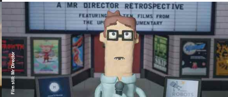
Film still: Mr Director

Drama / Comedy / Animation / Music Video