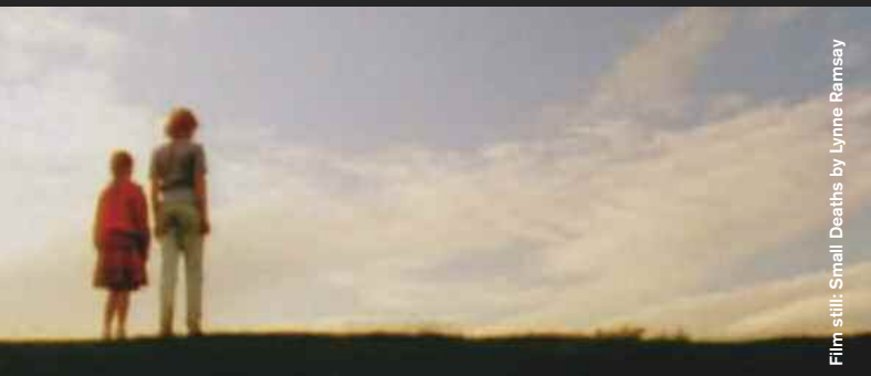
Film still: Small Deaths by Lynne Ramsay

(Retrospective part 1 on 13 January at Sputnik Kino)