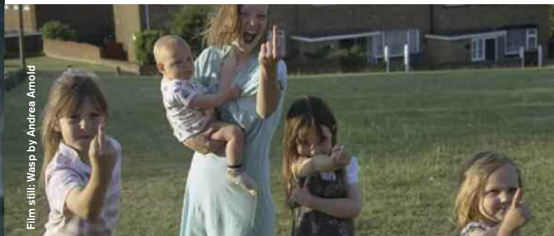
Film still: Wasp by Andrea Arnold

(Retrospective part 2 on 15 January at Acudkino)