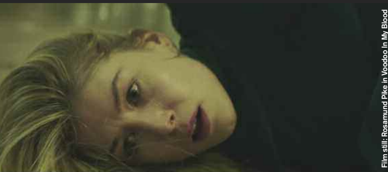
Film still: Rosamund Pike in Voodoo In My Blood

Drama / Comedy / Animation / Thriller / Music Video