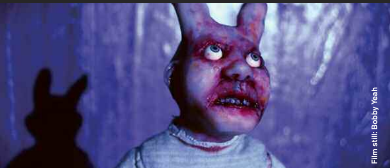
Film still: Bobby Yeah

Horror / Slasher / Thriller / Sci-Fi / Animation / Black Comedy / Music Video