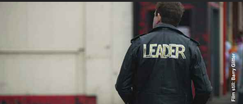
Film still: Barry Glitter

Drama / Comedy / Mockumentary / Music Video