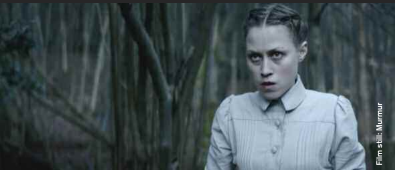
Film still: Murmur

The Wisdom Of Pessimism (Animation) D: Claudio Salas, 2:30 Gegen jegliche Unzufriedenheit hilft eine gute Portion Pessimismus. All you need is pessimism!