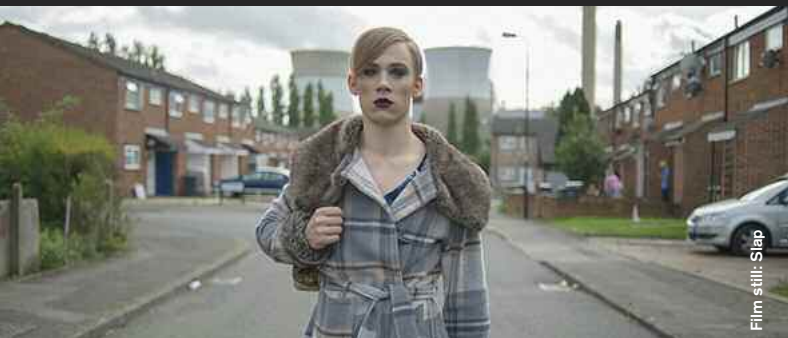
Film still: Slap

Switch (Drama) D: Aneil Karia, 10:00 Ein ganz normaler Einkauf im Supermarkt gerät für einen jungen Vater zum Thriller. In the blink of an eye, a young father's life is thrown into turmoil.