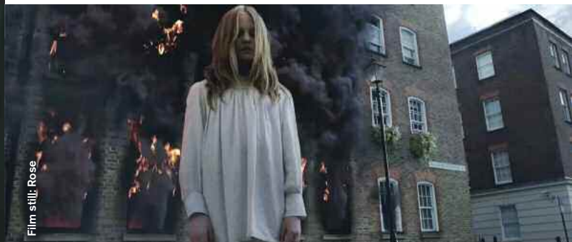
Film still: Rose

The Simpsons Couch Gag (You're Next) (Animation) D: Lee Hardcastle, 1:30 Blutige Knet-Simpsons treffen auf den Horror-Hit "You're Next". The film title says it all!