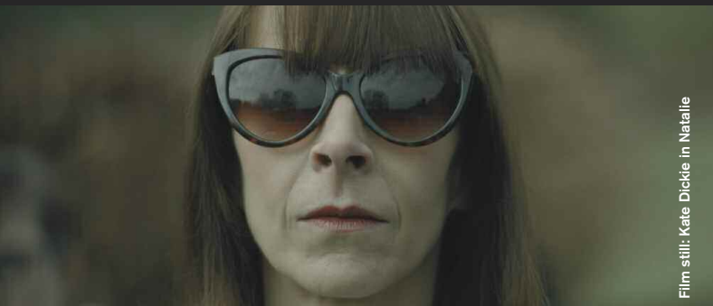
Film still: Kate Dickie in Natalie

Short film screenings and talk with Kate Dickie and Phil Collins