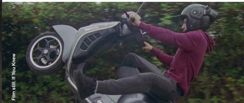
Film still: If You Knew

If You Knew (Documentary), D: Stroma Cairns, 5:20 Zwei Brüder treffen sich nach längerer Nicht-Kommunikation. After months of fighting, two brothers come together.