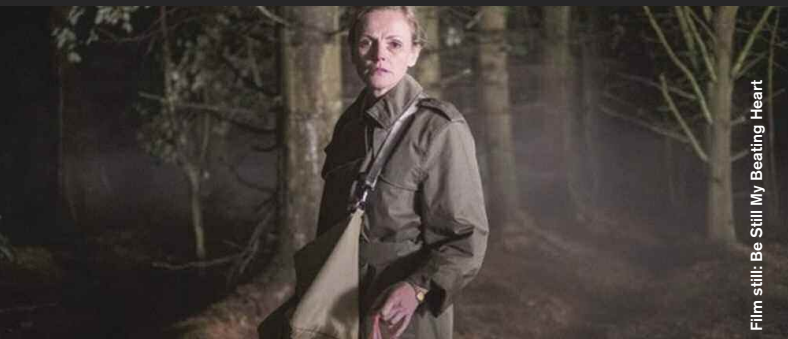
Film still: Be Still My Beating Heart

Comedy / Animation / Drama / Sci-Fi / Experimental / Mystery