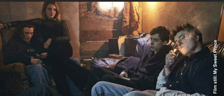
Film still: My Sweet Prince

Alien Culture (Drama), D: Iesh Thapar, 16:00 Southall, 1979. Rassismus ist allgegenwärtig und Lucky sorgt sich um seinen Bruder. Racial tensions are running high. Lucky thinks his brother is in trouble, but the truth is far from what he expected.