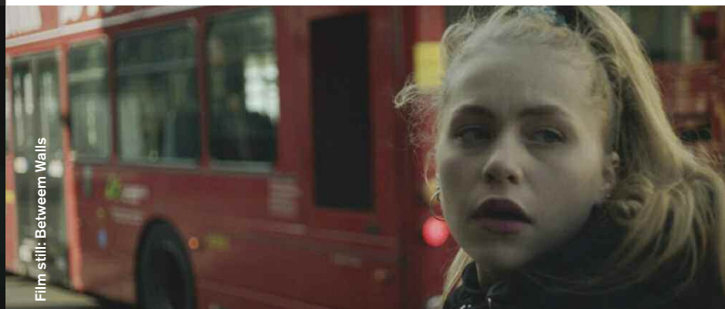
Film still: Between Walls

Sci-Fi / Thriller / Drama / Animation / Documentary / Comedy / Coming of Age