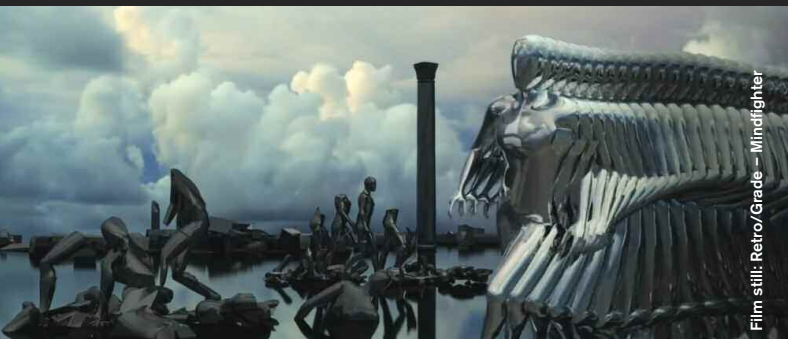
Film still: Retro/Grade – Mindfighter

Music Video / Experimental / Animation / Promo