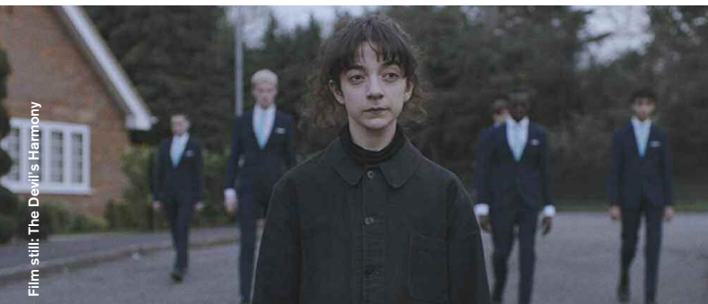
Film still: The Devil's Harmony

Coming of Age / Mystery / Drama / Animation / Comedy / Experimental