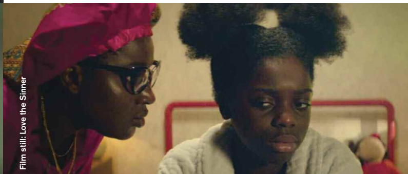
Film still: Love the Sinner

Comedy / Drama / Animation / Mystery / Coming of Age / Music Video