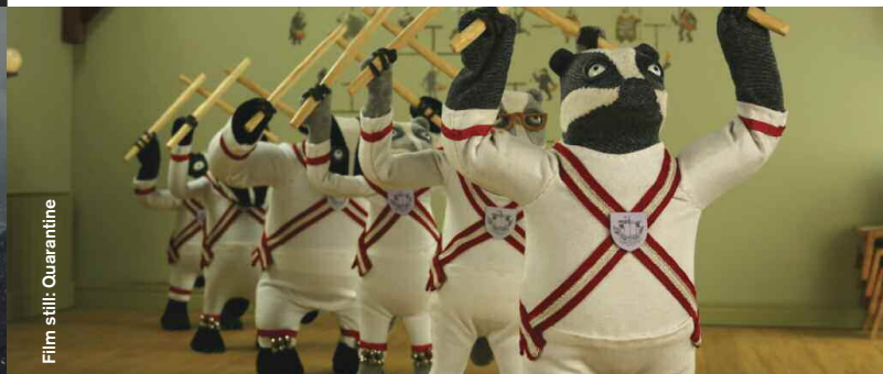
Film still: Quarantine

Animation / Comedy / Drama / Experimental / Music Video