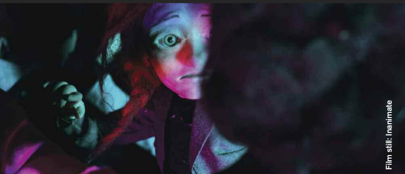
Film still: Inanimate

British Shorts hat immer einen besonderen Fokus auf den Animationsfilm gelegt. Dieses Retrospektive-Screening versammelt Highlights der Festivalausgaben 2007 bis 2019. Filmbeschreibungen auf www.britishshorts.de