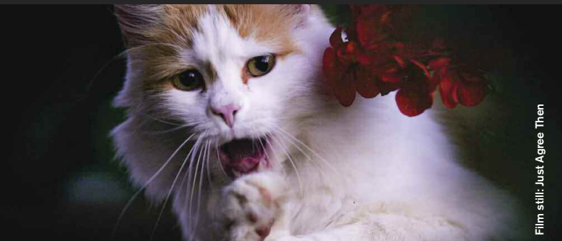
Film still: Just Agree Then

Comedy / Sci-Fi / Drama / Animation / Documentary