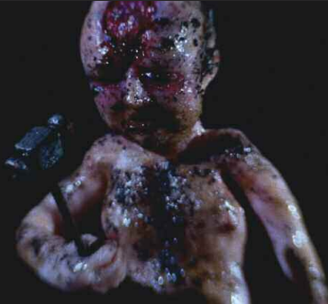
Film still: Tomorrow I Will Be Dirt

Thriller / Horror / Sci-Fi / Animation / Black Comedy / Experimental / Drama