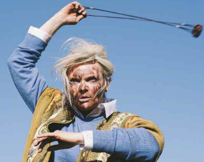
Film still: Slingshot

Drama / Experimental / Coming of Age / Romance / Comedy