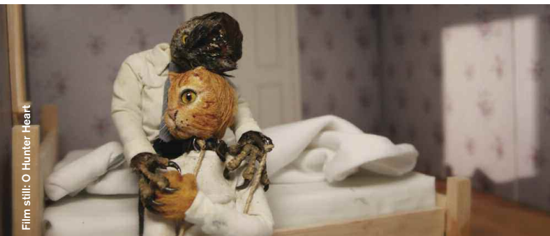
Film still: O Hunter Heart

Drama / Thriller / Comedy / Animation / Coming of Age / Music Video