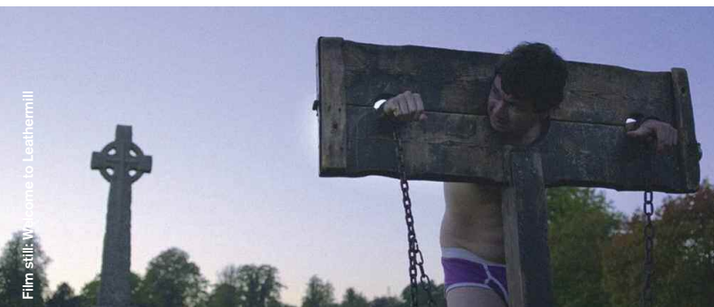
Film still: Welcome to Leathermill

Black Comedy / Animation / Experimental / Music Video