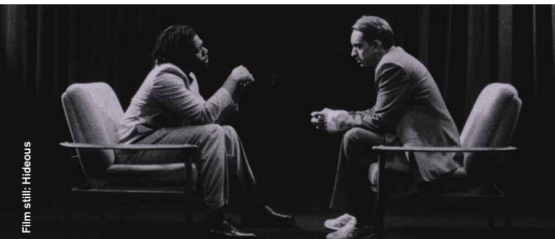
Film still: Hideoous

Comedy / Drama / Horror Musical / Animation