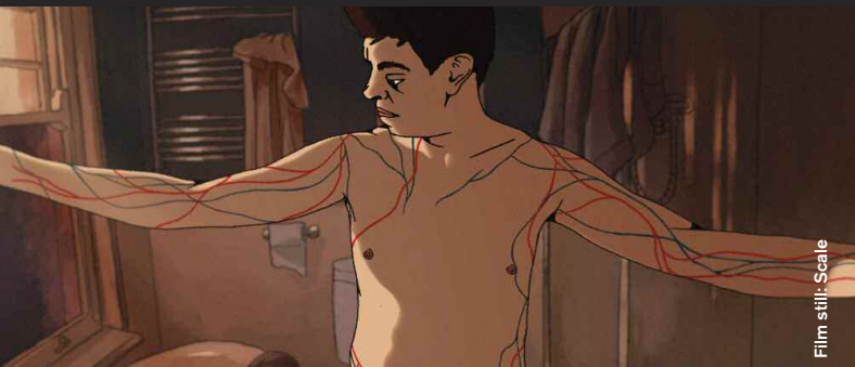
Film still: Scale

Animation / Drama / Comedy / Coming of Age