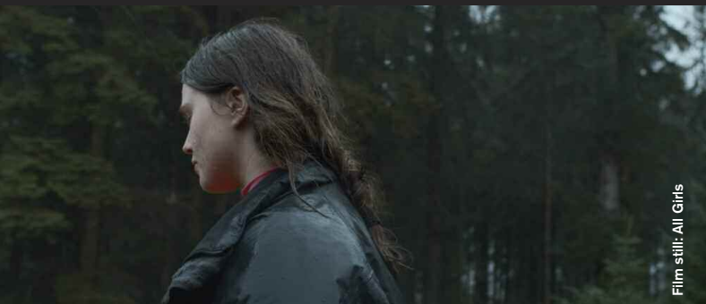
Film still: All Girls

Drama / Mystery / Animation / Comedy / Thriller