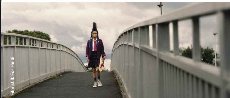
Film still: For Heidi

Joy (Drama), Dir: Alexandra Brodski, 20:00 Ein Insasse einer Jugendstrafanstalt ist von einer 10-Jährigen mit einer besonderen Macht fasziniert. A teenage inmate at a juvenile detention centre is drawn to a 10-year-old girl with an intoxicating power.