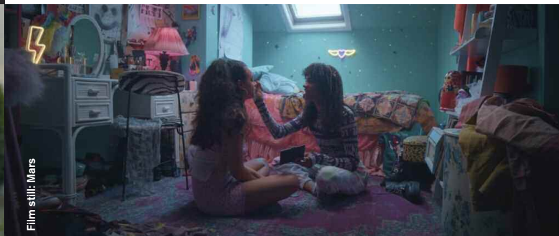
Film still: Mars

Drama / Animation / Comedy / Coming of Age