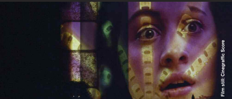
Film still: Cinegraffic Score

Home (Documentary), Dir: Christine Saab, 17:31 Eine Filmemacherin stößt auf alte Liebesbriefe ihrer Eltern, die zwischen Japan, Saudi-Arabien und dem Libanon verschickt wurden. A filmmaker comes across her parents' old love letters, sent between Japan, Saudi Arabia and Lebanon.