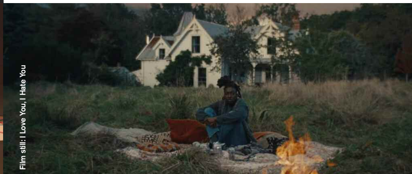
Film still: I Love You, I Hate You

Drama / Coming of Age / Comedy / Animation