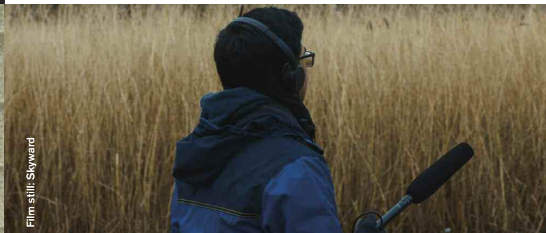
Film still: Skyward

Land of Fires (Documentary), Dir: Chloe White, Will Davies, 24:00 In Neapel versucht eine Bürgerinitiative, gegen illegale Müllverschmutzung zu kämpfen. In Naples, a band of local residents have formed a vigilante justice group to fight against the illegal dumping of toxic waste.