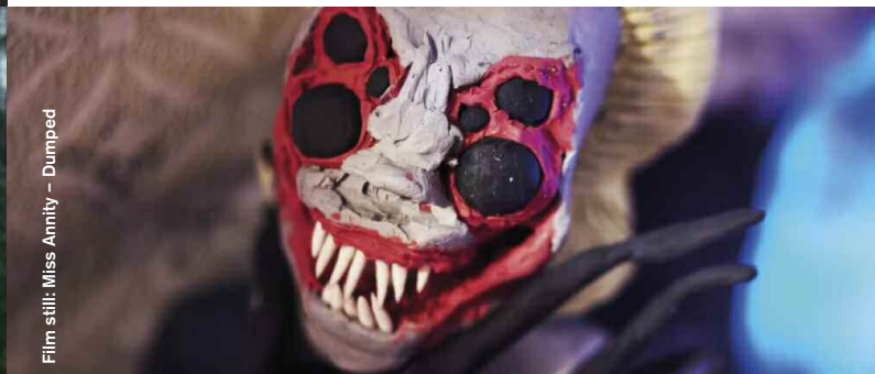
Film still: Miss Amnity – Dumped

Horror / Musical / Fantasy / Animation / Folk Horror / Dark Comedy