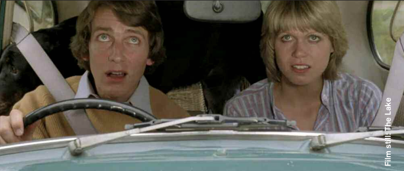
Film still: The Lake

Drama / Experimental / Mystery / Horror / Thriller