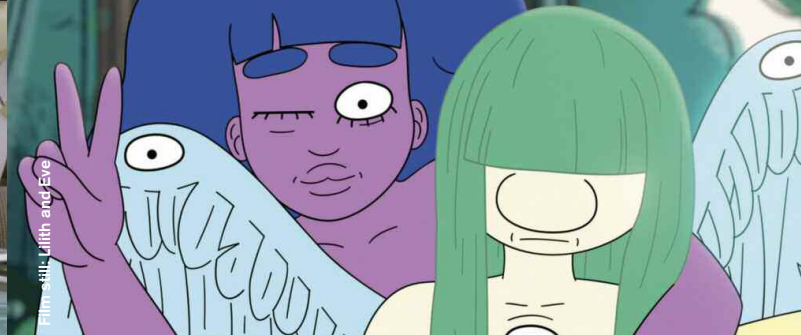
Film still: Lilith and Eve

Animation / Comedy / Mystery / Music Video