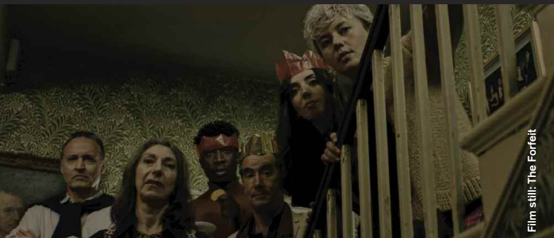
Film still: The Forfeit

Drama / Comedy / Science Fiction / Comedy / Music Video / Animation / Fantasy