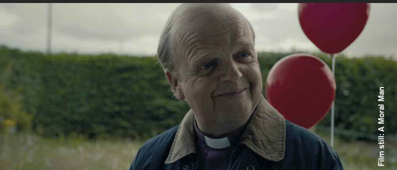
Film still: A Moral Man

Drama / Comedy / Coming of Age / Animation