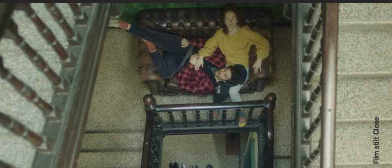
Film still: Close

The Mouse (Drama), Dir: Theo Baines, 19:00 Ein obdachloser 17-Jähriger stellt sich der Polizei in Ost-London und erzählt seine Story. A homeless seventeen-year-old, injured and wielding a metal pipe, turns himself into police in east London.